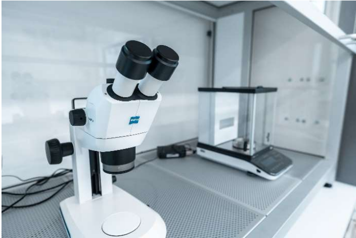
Partikeluntersuchung mit Mikroskopie und Laborwaage in Reinraumumgebung im Boltzmann Labor